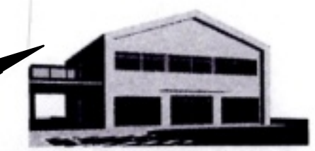
向日市観光交流センター完成予定図