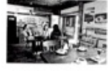
飲食物提供スペース

観光バスが、2台、自動車が19台止まれるスペースがあり、 1階は、野菜などを売ったり、食事をしたりするところや、トイレがあります。 2階は、展望デッキで、列車が見れます。