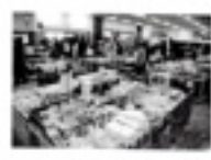
特産品等展示、販売スペース